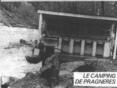
LE CAMPING DE PRAGNERES