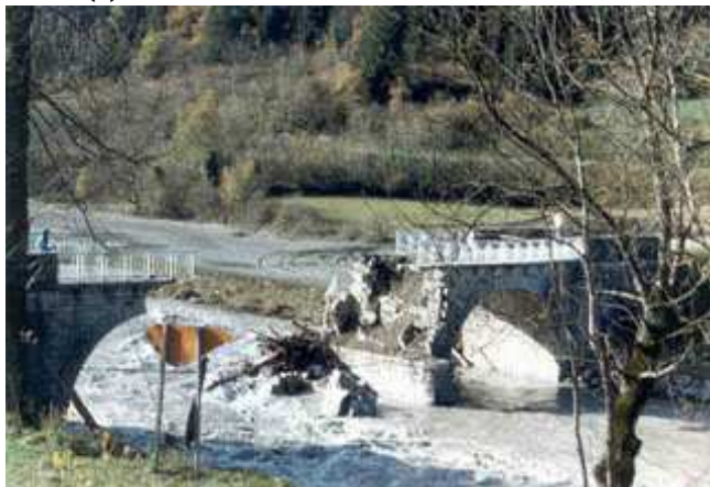
Pont de Bazus-Aure