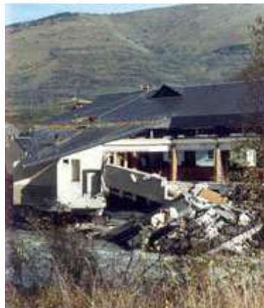
Salle polyvalente de Saint-Lary