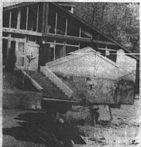
glisse à la Neste

● Sous la pression des eaux qui avaient chahuté d'énormes blocs de bois, stockés à proximité, sur les berges, et qui faisaient bouchon entre les arches, le pont de Bazus-Aure, sur le N.N. 920, s'écroula vers 21 heures, juste après le passage du car ramenant les rugbymen de Saint-Lary. La circulation se fit par le C.D. 29.